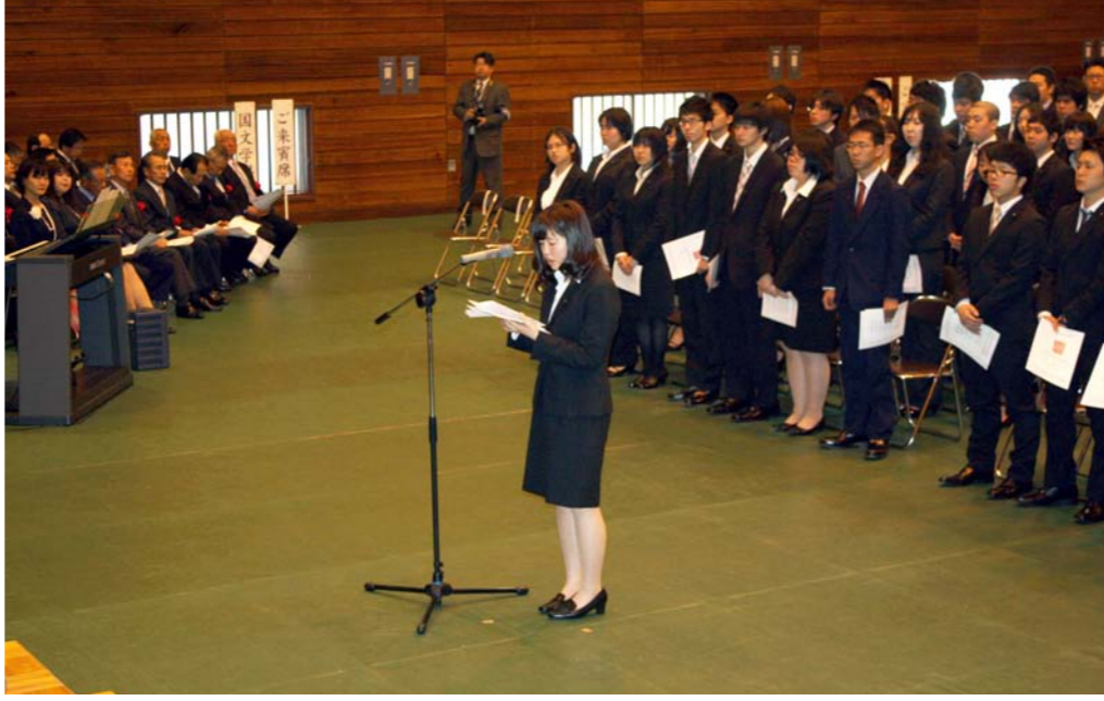
入学式で夢と希望を膨らませる新入生たち

私は、高校卒業して一年間、中学校の教員として働きました。そこで、先輩の先生に出会い、仕事や教員生活について、私の夢が小学校の先生になることでもあり、教員としての仕事をする傍ら、先生生徒と積極的に関わって、充実した日々を送ることができると。今年終業、私はこの目標に向かって努力してまいります。