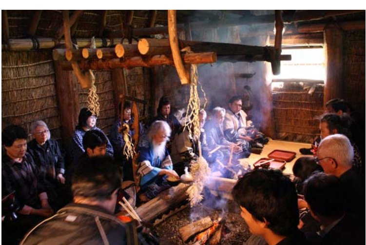
初日は地層とアイヌ文化、2日は有珠山の活動などについて、事前の教材研究を行い、その内容を高度に理解するのを目指した。後、様々な視点から児童を避難させるにはどうするかを想定し、初等教育研究誌にまとめた。