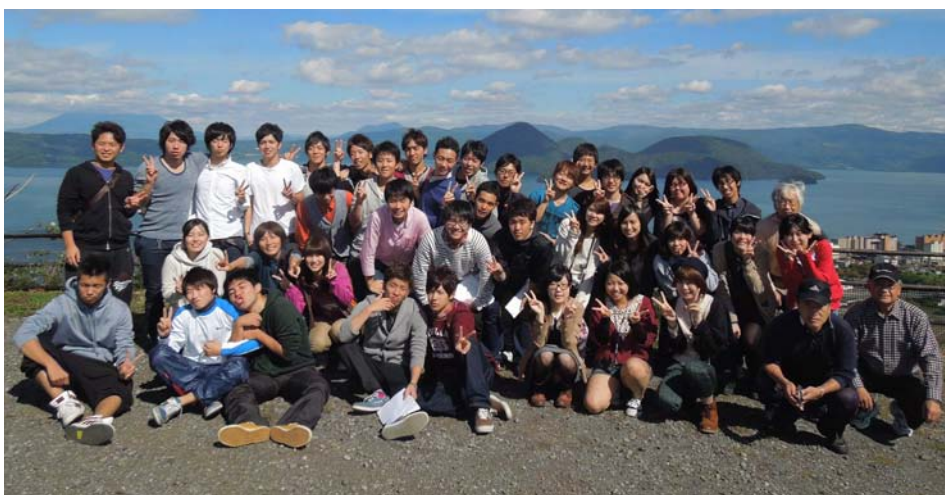
3日目は小樽の歴史の変遷について金融面・運送面・漁業面の視点から学習しました。小樽が栄えていった様子や現在の観光地になるには人々の様々な努力があったと学びました。

祭儀から始まり、アイヌの踊りや楽器の演奏、最後はアイヌ料理を食べていただく。この祭りに通じて、信仰から生まれる一体感を共有する。アイヌ文化は信仰と生活が密着している。祭りの時、祈りを込めて、一年の健康と安全を祈願し、一体感を共有する。