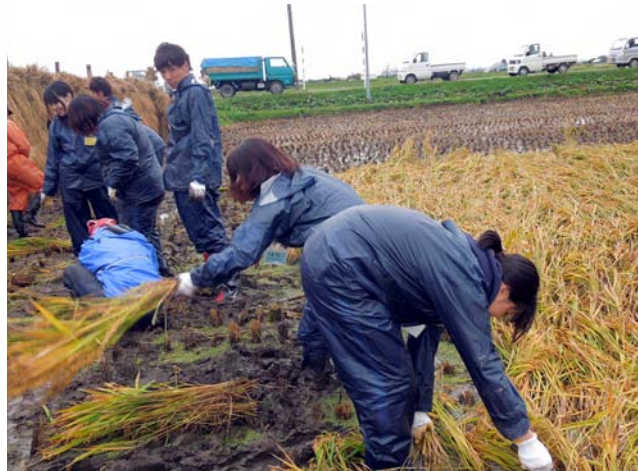
稲刈り体験をした。稲刈り体験は農家の方々に指導していただき、稲は6束を刈り、それを1束にまとめ、まとめた稲で50〜60秒で立派に成長していました。

10月1日、稲刈り体験をした。稲刈り体験は農家の方々に指導していただき、稲は6束を刈り、それを1束にまとめ、まとめた稲で50〜60秒で立派に成長していました。