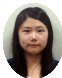
幼稚園実習は初めての経験という人もあり、期待と不安からのスタートでした。幼稚園では一日に行うことがたくさんあり、流れについていくことで精一杯でした。

幼稚園実習は初めての経験という人もあり、期待と不安からのスタートでした。幼稚園では一日に行うことがたくさんあり、流れについていくことで精一杯でした。子どもたちに「次はこれをしよう」といって、周囲の人々のように関わり、わが子の成長を学んでいく大切な段階にある。道具の使い方、お部屋やホールを使う上での約束など、保育者として